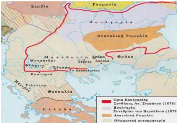
4. Όρια της Βουλγαρίας. Συνθήκη του Αγίου Στεφάνου 1878