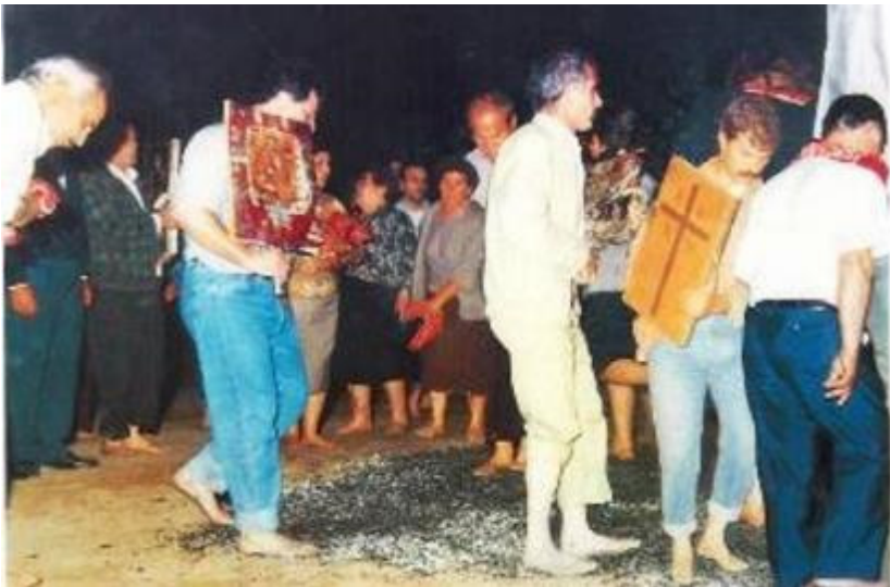
2. Αναστενάρια 1991. Πυροβασία Λαγκάδας Θεσσαλονίκης