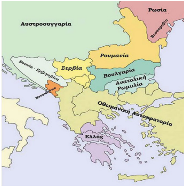
3. Χάρτης των Βαλκανίων με τη συνθήκη του Βερολίνου