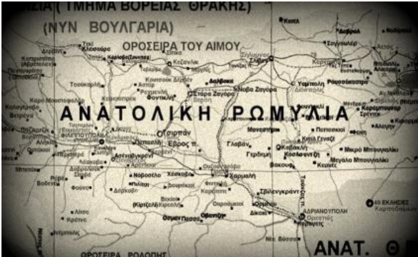
5. Χάρτης της Ανατολικής Ρωμυλίας