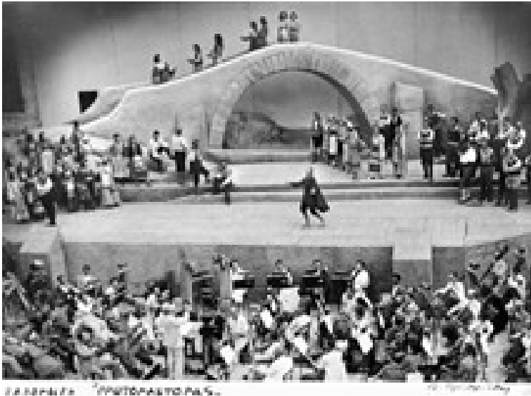
Η αφίσα της όπερας του Μ. Καλομοίρη «Πρωτόμαστορας» του Ν. Καζαντζάκη το 1944