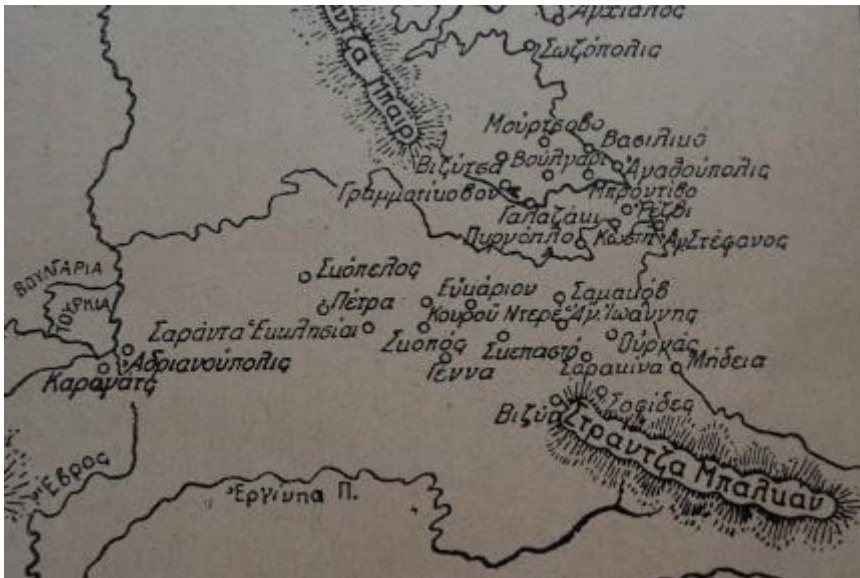
6. Στράντζα (χωριό Κωστή). Περιοχή που ξεκίνησε το έθιμο των Αναστενάρηδων